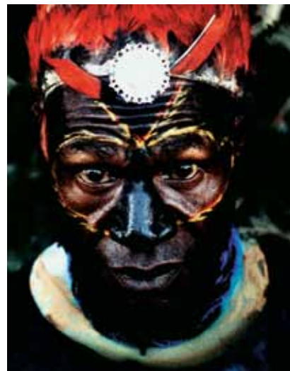
Huvudjägare på Papua Nya Guinea, 1974.