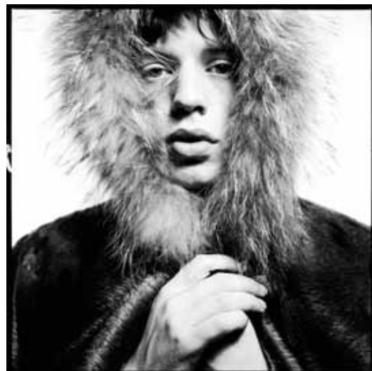
Mick Jagger, 1965.