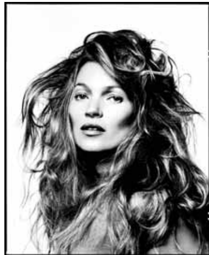
Kate Moss, 2013.