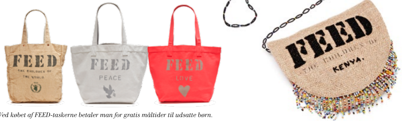
Ved købet af FEED-taskerne betaler man for gratis måltider til udsatte børn.