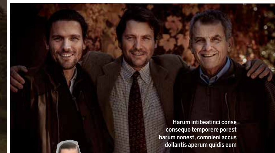
Harum intibeatinci conse consequo temporere porest harum nonest, commieni accus dollantis aperum quidis eum

Modehuset Ferragamo började med skor men säljer i dag kläder, accessoarer och mycket annat. Här en look från Ferragamos höst/vinter 2016-visning.