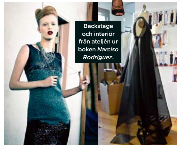
Backstage och interiör från ateljén ur boken Narciso Rodriguez.