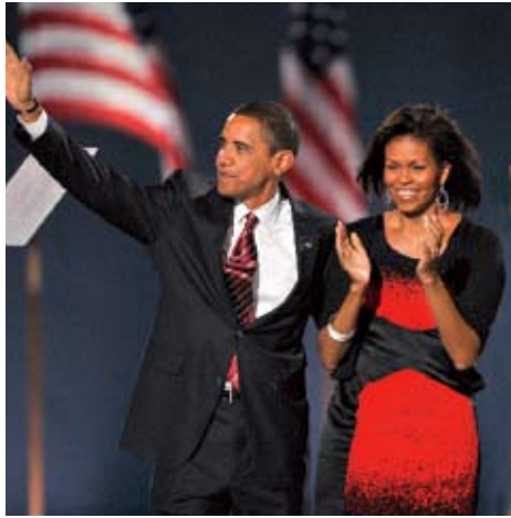
Michelle Obama firade maken Barack Obamas seger i Narciso Rodriguez design - under både valvakan (bilden) och presidentinstallationen.