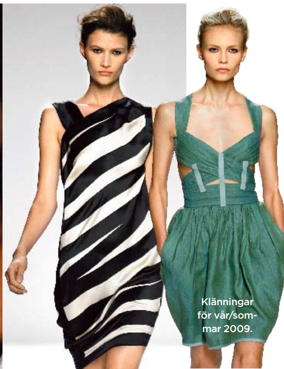
Klänningar för vår/sommar 2009.