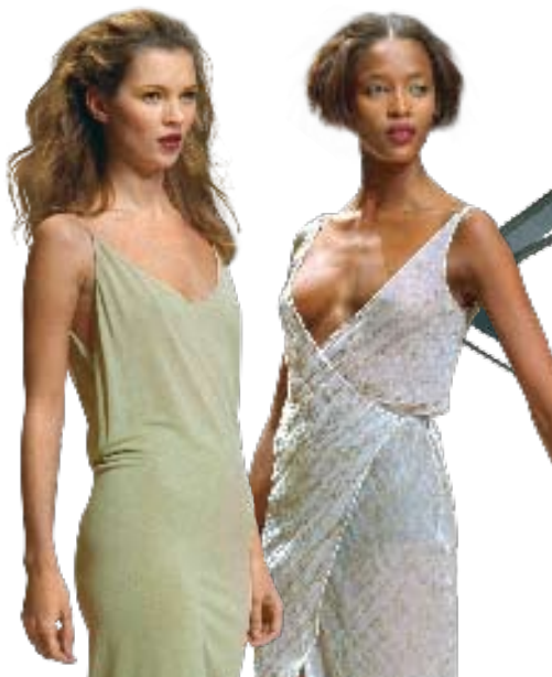
Narciso Rodriguez för Cerruti våren 1997.