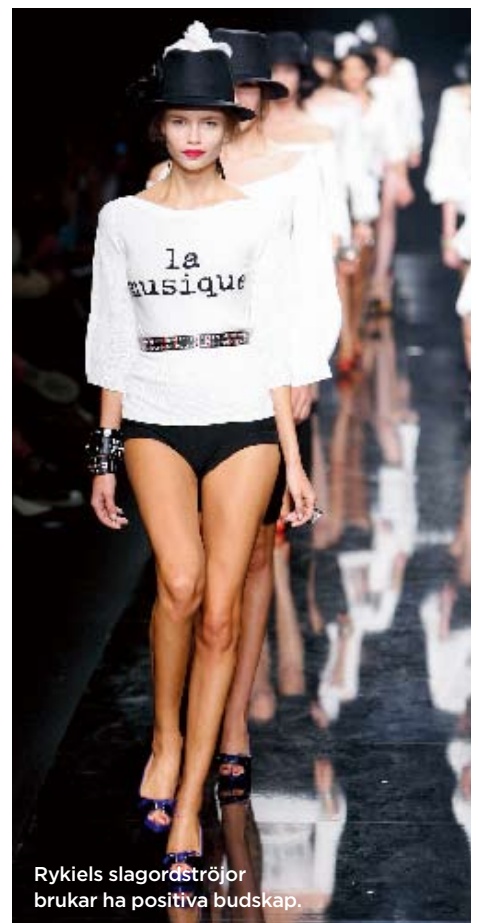
Rykiels slagordströjor brukar ha positiva budskap.

– Nathalie har bara fortsatt på den bana som jag tog när jag uppmanade kvinnorna att kasta behån. Erotik är en del av mitt liv. Jag tycker om att provocera, säger Sonia Rykiel. □