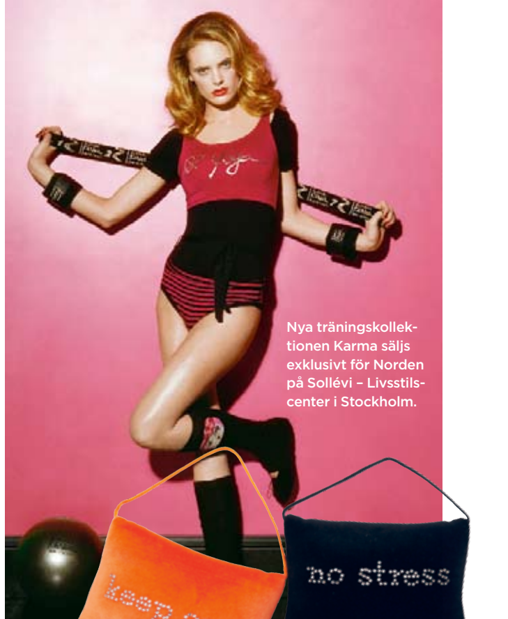
Nya träningskollektionen Karma säljs exklusivt för Norden på Sollévi – Livsstilscenter i Stockholm.

– Jag kan inte nöja mig med det som redan finns. Jag har behov av att ändra, göra om och sätta till en massa färger. När jag var liten sa folk alltid att jag skulle ”sluta ljuga”. Men för mig var det inte lögn, det var fan-