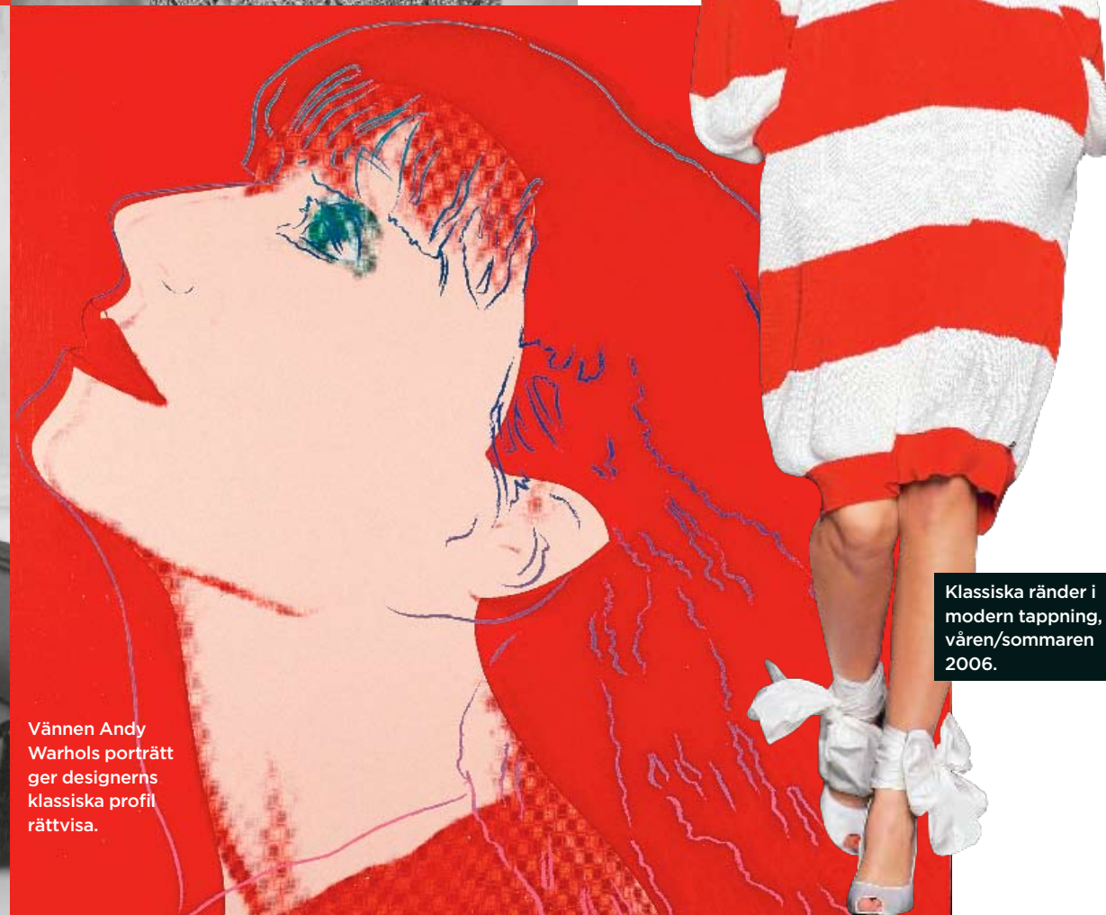
Klassiska ränder i modern tappning, våren/sommaren 2006.