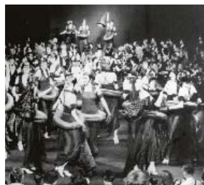
Rykiel brukar stå för Paris mest myllrande visningsfinaler.