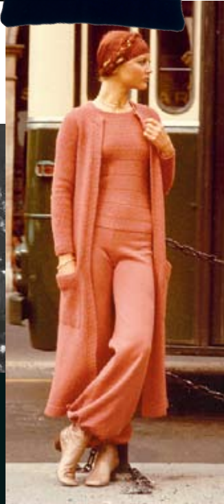
Till höger: Stickat från topp till tå i tidens anda från 70-talet.