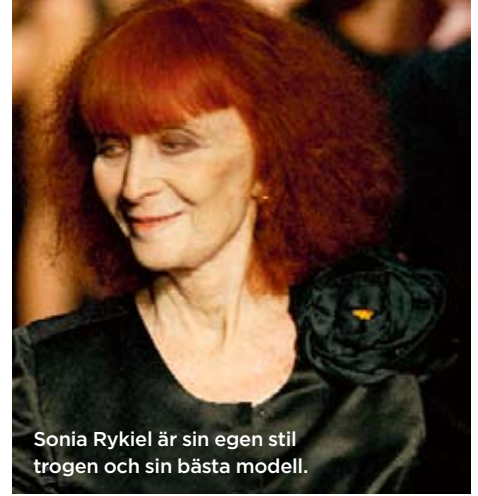
Sonia Rykiel är sin egen stil trogen och sin bästa modell.

– Jag har haft en otrolig tur som har min