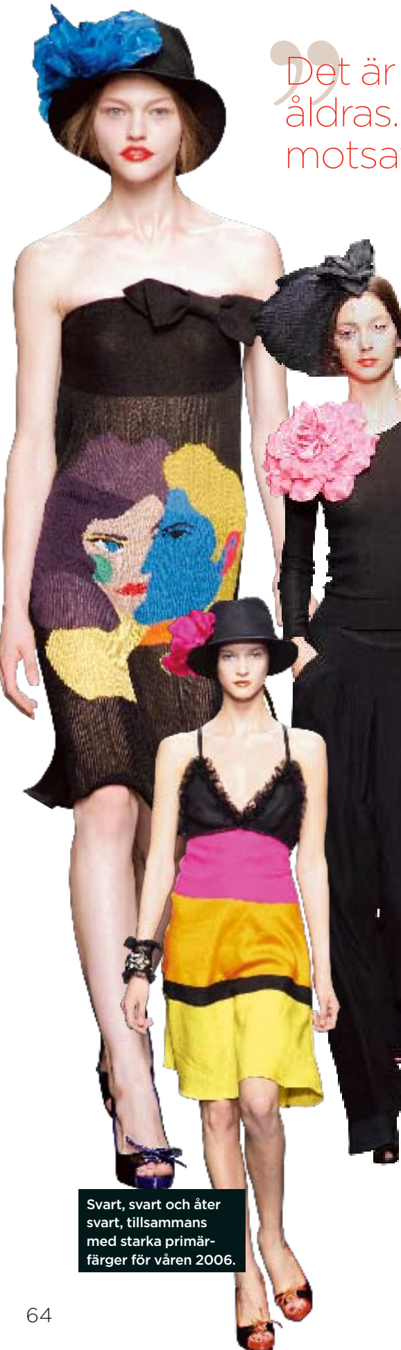
Svart, svart och åter svart, tillsammans med starka primärfärger för våren 2006.

Det är förskräckligt att åldras. De som säger motsatsen är imbecilla.