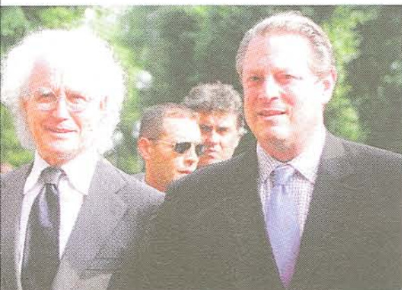
Benettos grundlægger og ildsjæl, Luciano Benetton, havde inviteret Al Gore til lanceringen af Colors' seneste magasin, som foregik på Triennalen i Milano.