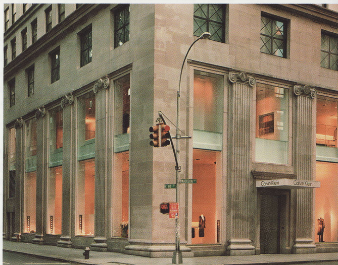
Calvin Klein i New York. Alt overflødigt er skåret væk, så Kleins filosofi fremstår så rent som muligt.

Forretningen ligger på den eksklusive shoppinggade Avenue Montaigne og er en fritstående, Haussmansk bygning fra 1900-tallet. Modsat New Yorker-forretningens ranke tøjstativer, der er i overensstemmelse med byens arkitektur og arbejdsmiljø, afspejler mannequinerne på pariseradressen byens savoir vivre . Man drages til den gruppe af velklædte mennesker, som står midt i en intim konversation, lige som ens nysgerrighed vækkes af den kvinde, som står for enden af en lang, smal trappe for foden af en hvid lyssøjle, som synes at komme fra det ydre