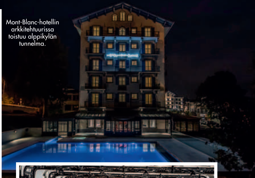
Mont-Blanc-hotellin arkkitehtuurissa toistuu alppikylän tunnelma.