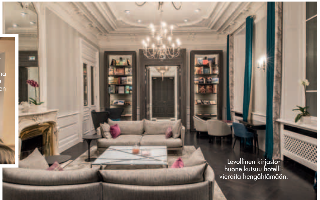
Levollinen kirjasto-huone kutsuu hotelli-vieraita hengähtämään.