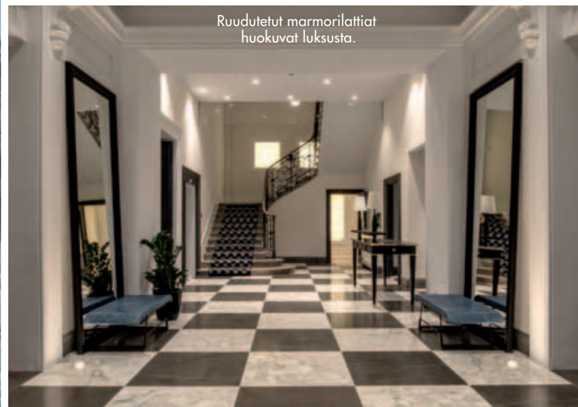
Ruudutetut marmorilattiat huokuvat luksusta.

V alkoinen hotelli sijaitsee ranskalaisen alppikylän sydämessä. Se on osa Chamonix'n alueen rikasta historiaa – samoin kuin tänne aina 1700-luvulta asti saapuneet vuorikiipeilijät.