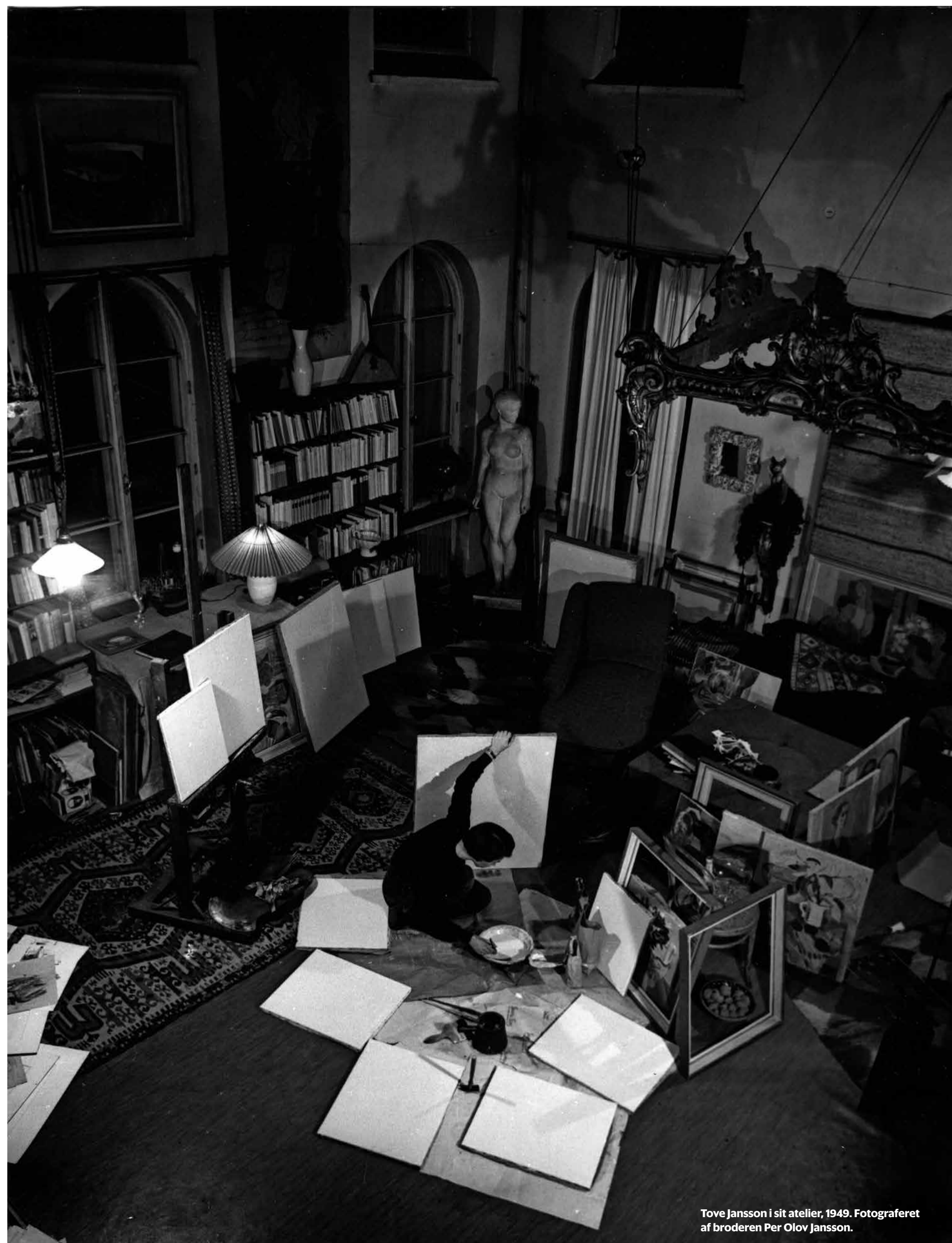
Tove Jansson i sit atelier, 1949.