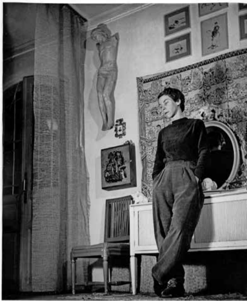
Tv: Tove Jansson, portræt fra 1940'erne. Th: Selvportræt 1942.

I udstillingen på Gl. Strand er Tove Janssons viser selvportrætterne hendes udvikling fra en selvbevidst ung kvinde med rævestola og cigare, til en tankefuld, aldrende kvinde i dét,