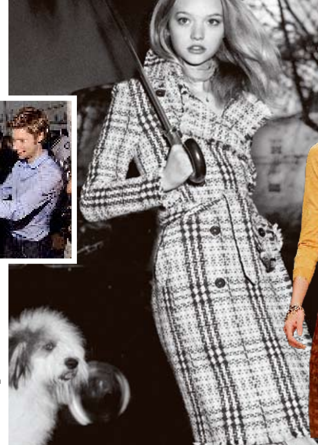
Trenchcoaten är ett av Burberrys signum. Här i en modern variant på australiska toppmodellen Gemma Ward.