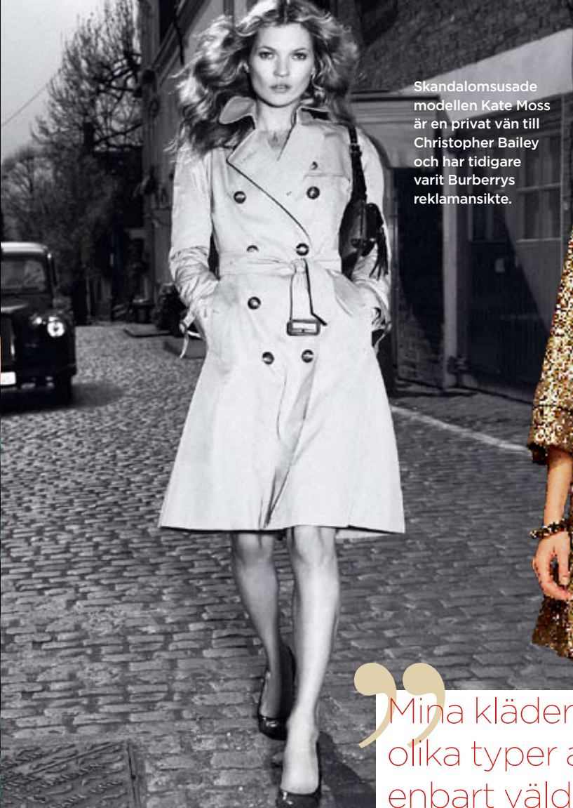
Skandalomsusade modellen Kate Moss är en privat vän till Christopher Bailey och har tidigare varit Burberrys reklamansikte.