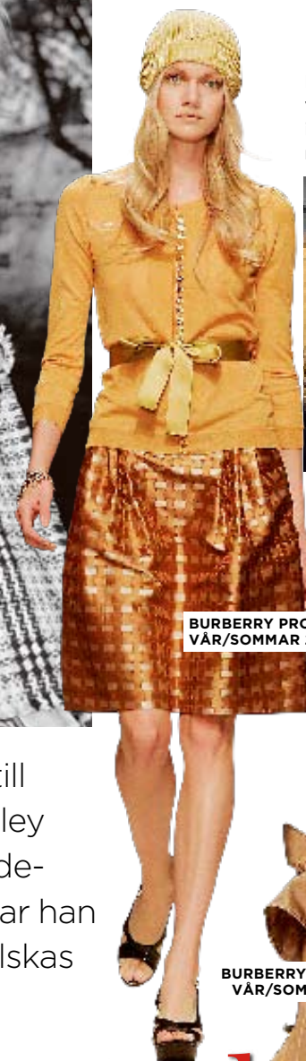
BURBERRY PRORSUM VÅR/SOMMAR 2006