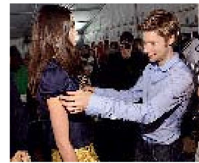
Prova, prova och åter prova ... Inget lämnas åt slumpen inför en visning.