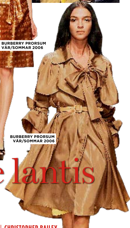
BURBERRY PRORSUM VÅR/SOMMAR 2006

Han har blåst liv i Burberry-rutan och utsetts till årets designer av Vogue. Men Christopher Bailey känner sig fortfarande som en nybörjare i modevärlden. Ointresserad av utstuderat mode kallar han sig demokratisk designer – ett koncept som älskas av såväl Madonna som brittiska pensionärer.