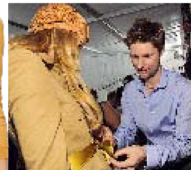
Engagerad. På Burberrys visningar är Christopher Bailey involverad i allt från mode och musik till inredning och mat.