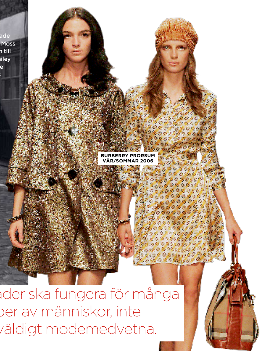
BURBERRY PRORSUM VÅR/SOMMAR 2006