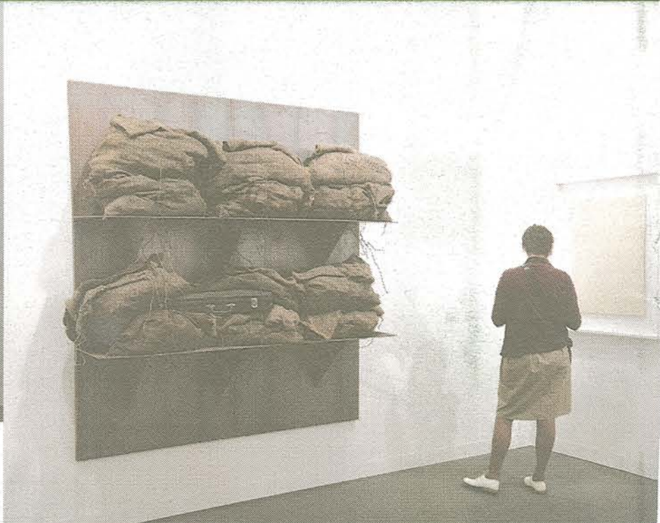
Kulsække med violinetui af Jannis Kounellis fra det tyske galleri Karsten Greve.