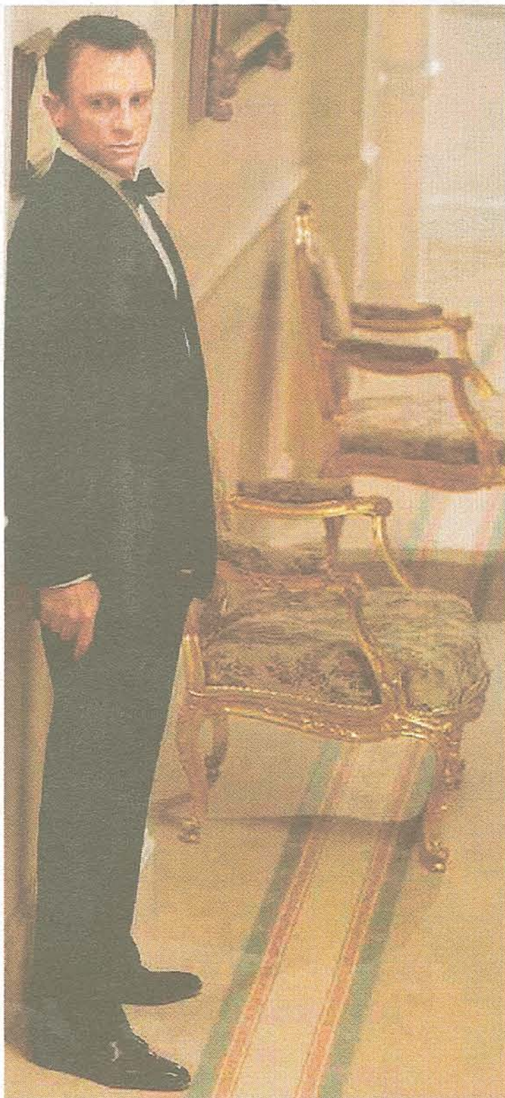
I forbindelse med den nye Bond-film lancerer Brioni »The Bond Tuxedo« med bl.a. hemmelige lommer og en krave med indbygget stålkabel!

Med sin nonchalante elegance er James Bond blevet stilikon for mænd over hele verden. Det er det italienske modehus, Brioni, som står bag den britiske agents ulastelige jakkesæt. Af Camilla Alfthan