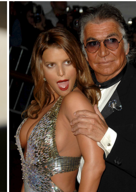
Jessica Simpson og Roberto Cavalli. Hun er i Cavallis bl.a. bl.a.