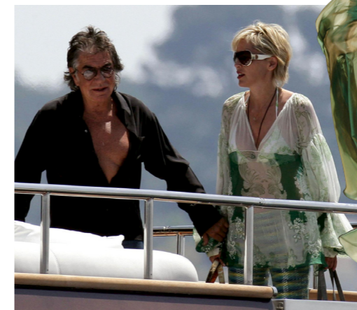
May 23rd, 2007 60e Cannes Film Festival - Sharon Stone og en anden kvinde nyder sig på Roberto Cavallis lystbåd.