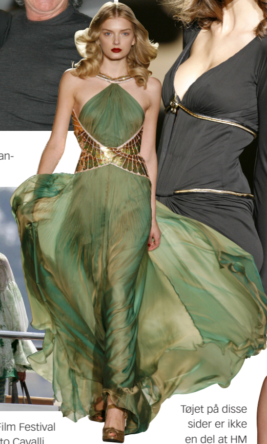
Tøjet på disse sider er ikke en del af H&M kollektionen.