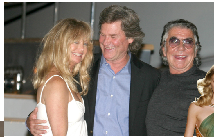
Goldie Hawn, Kurt Russell og Roberto Cavalli - soiree sur le bateau de Roberto Cavalli à la Cannes Boat Party i Cannes, Frankrig.