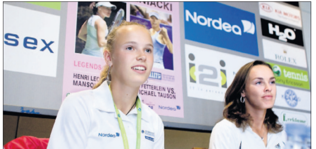
Martina Hingis spillede mod Caroline Wozniacki i en opvisningskamp i 2007 i KB-Hallen. Nu hepper hun på danskeren.