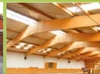
Kirk Arabians, Martofte