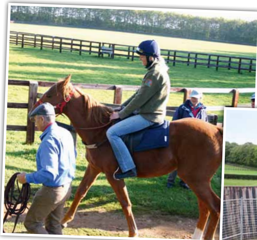
Senere er det tid til sadel og den første rytter.