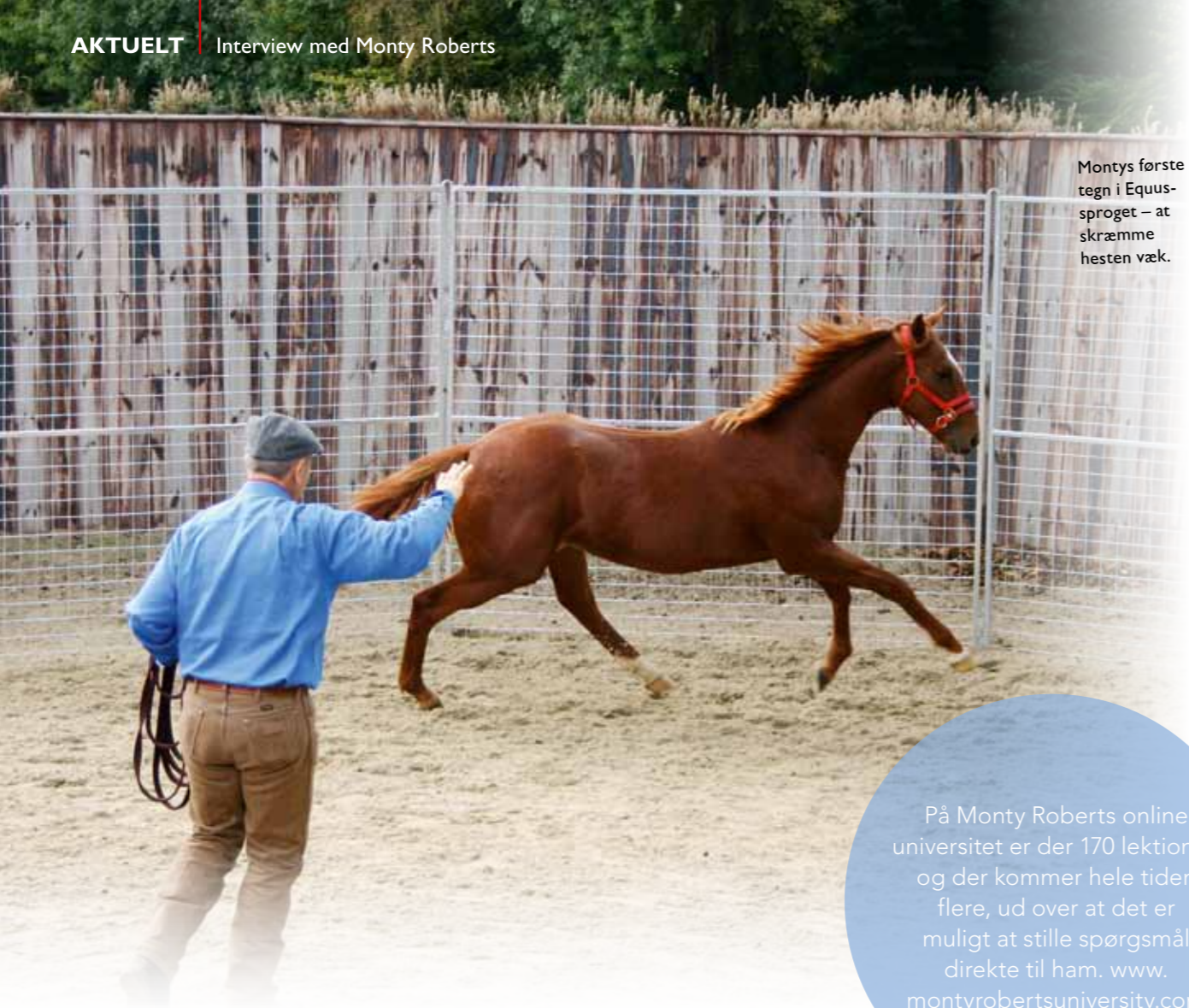
Montys første tegn i Equus-sproget – at skræmme hesten væk.

På Monty Roberts online universitet er der 170 lektioner, og der kommer hele tiden flere, ud over at det er muligt at stille spørgsmål direkte til ham. www.montyrobertsuniversity.com