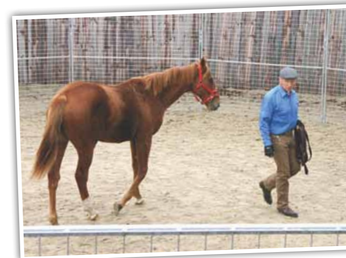
Bagefter begynder magien når det er tid til Join-Up.

– Danskerne og hollænderne er måske mere agtpågivende end de fleste andre. Franskmandene har været gode til at introducere arabere i varmblodshestene, så de springer højere og ser anderledes ud, da de har fået en lettere knoglebygning.