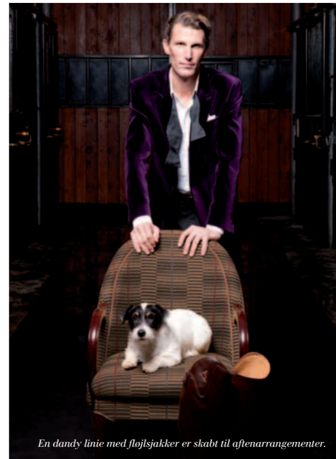
En dandy linie med fløjlsjakker er skabt til aftenarrangementer.

Når jakken sidder tæt til kroppen, er det ikke kun, fordi rytteren skal have maksimal bevægelsesfrihed, men også fordi den ikke pludselig må blafre i vinden, så hesten distraheres.