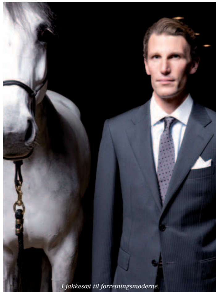
I jakkesæt til forretningsmoderne.

Ralph Laurens første design var således inspireret af en jakke, han havde fundet i en ridetøjsforretning til sin hustru.