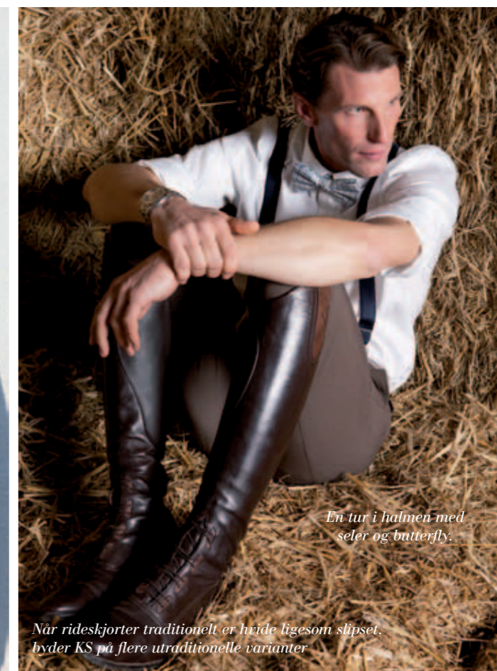
En tur i halmen med seler og butterfly.