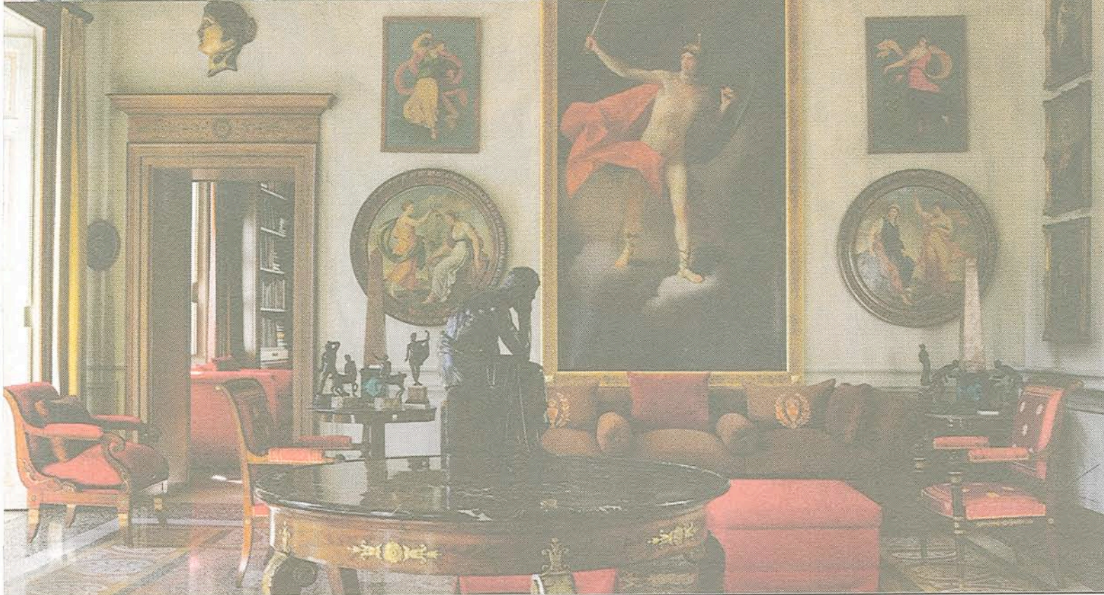
Øverst th: Vue af Villa Fontanelle, hvor Gianni Versace bragte nyklassisismen op til det 20. århundrede.