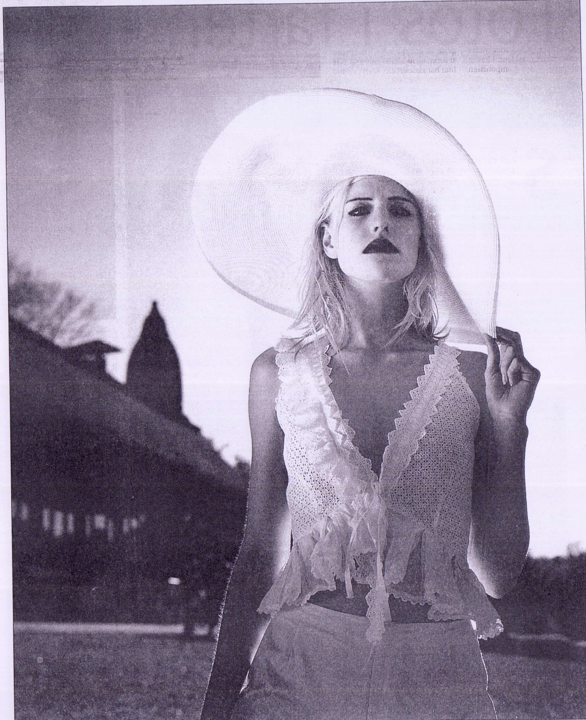
SKYGGE. Bredskygget stråhat til 1.700 kr. fra Juul, tagget top til 2.095 kr. fra MaxMara, Ny Østergade 7, Kbh. K.