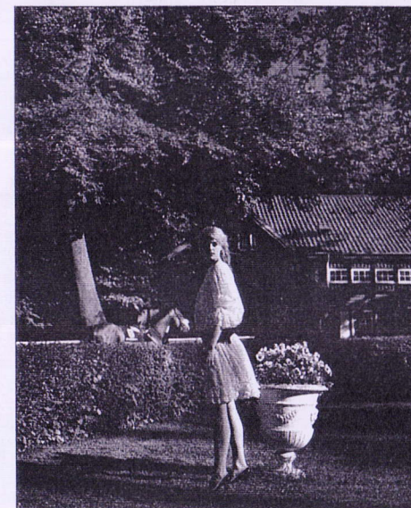
ATTITUDE. Bomuldskjole fra Marni til 5.725 kr., forhandles af Holly GoLightly, Gl. Mønt 2, Kbh. K. Chloé-smokingbælte 1.850 kr fra Stig P.

Tak til galopbanen i Klampenborg og Hesteejernes restaurant.