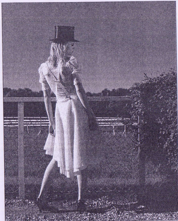
DANDY. Tophat til 1.250 kr. fra Décor, Rømersgade 9, Kbh. K, blondebodystocking koster 1.299 kr. fra Cacharel, nederdel med Grouchos seler fra Hansen/Madsen (kan bestilles på 33 93 88 30).