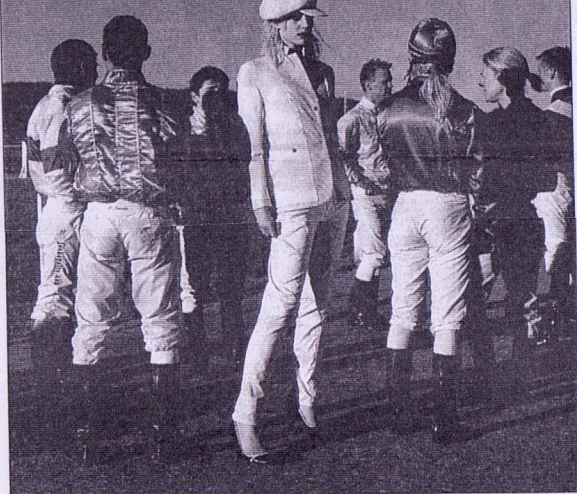
JOCKEY. Klubjakke fra Hansen/Madsen, prisen kan variere. Jodhpurs til 1.950 kr. fra Berglund/ Henriksen. Silkekasket 1.900 kr. fra Juul, Store Kongensgade 14, Kbh. K. Sko til 1.699 kr. fra Marc Jacobs, Kassandra, Grønnegade 27, Kbh. K.