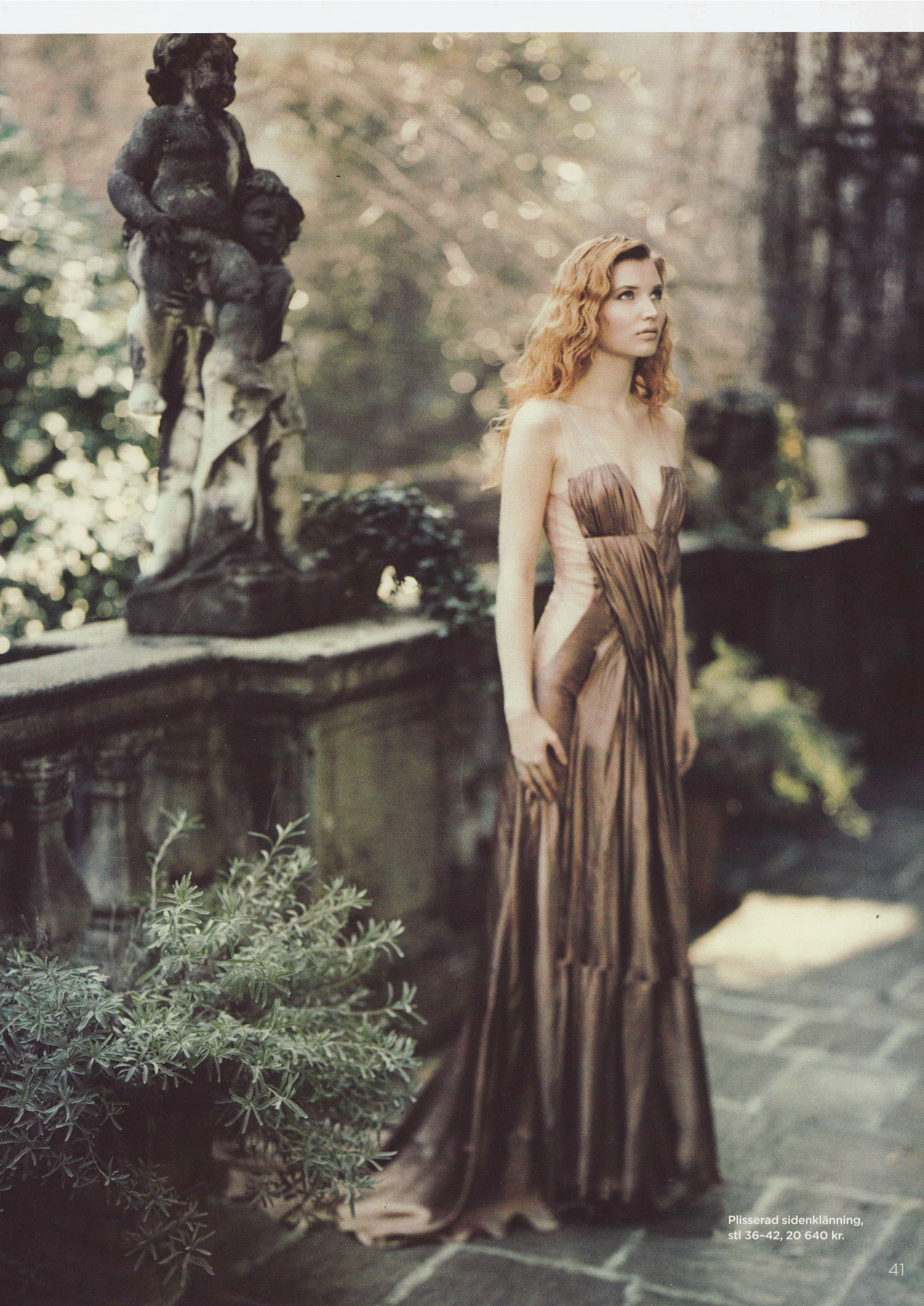
Plisserad sidenklänning, stl 36-42, 20 640 kr.